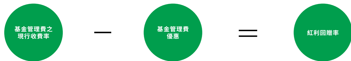
圖表一 6 基金管理費優惠